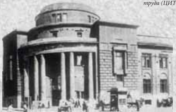
Центральный институт труда (ЦИТ)

План Заготовка Чистота Порядок Установка Вход в работу Режим Выдержка Еще раз чистота и порядок