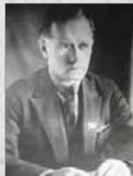
АЛЕКСЕЙ КАПИТОНОВИЧ ГАСТЕВ

Впрочем, и вне большевистского строя Алексей Капитонович был на переднем крае политической борьбы. После февраля 1917 года он стал секретарем ЦК Всероссийского союза рабочих-металлистов. Страна лежала в разлуке, на ее территории полыхала гражданская война, а Гастев пытается восстановить промышленное производство на заводах Петрограда, Харькова, Николаева. И когда военные сполохи стали наконец угасать, он пришел к логичному витку в своей биографии, создав и возглавив Центральный институт труда. Впрочем, помимо работы в области научной организации труда, Алексей Капитонович не без успеха осваивал и другую стезю — литературную.