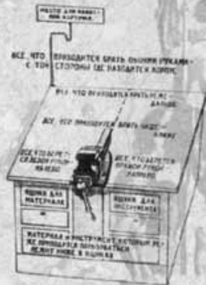
Правильное расположение инструмента (схема 1930-х годов)